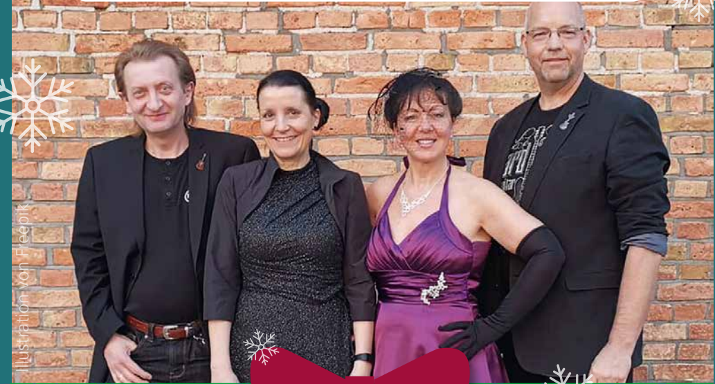
Illustration von Fredrik